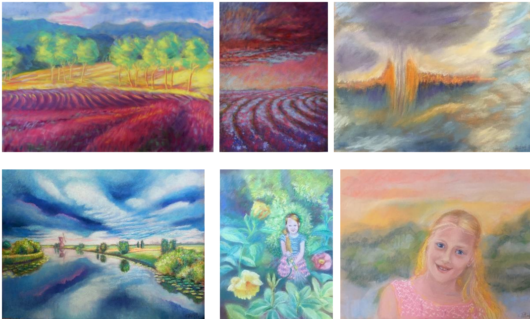
Pastelschilderijen: Landschappen en portretten 2017-18. Carina Mathot

Openingstijden: 12.00 t/m 18.00 uur. Info: www.ateliermathot.com